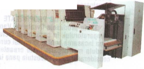
Print digital - XEROX Versant 80 Press